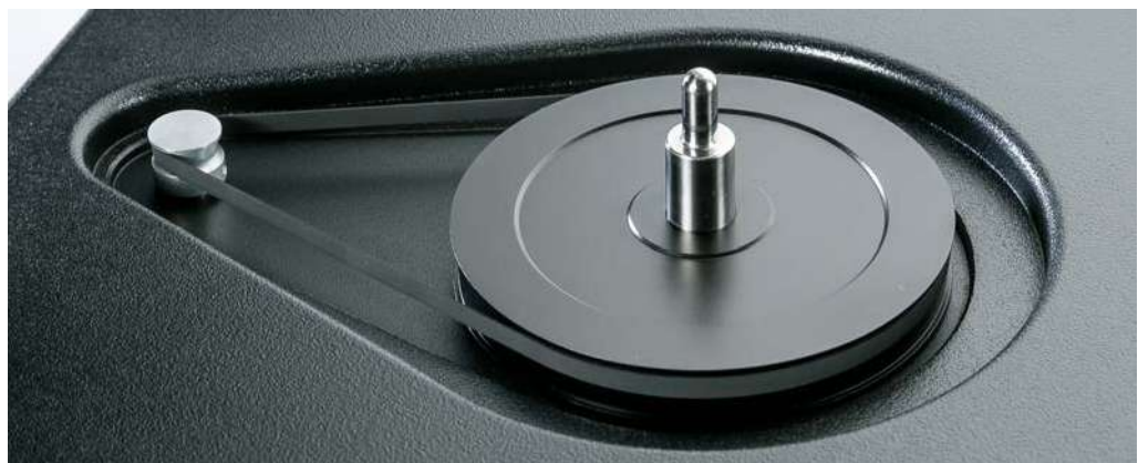
Der Synchronmotor mit Metall-Pulley treibt über einen kurzen Flachriemen den Subteller an. Beide Teile ins Kunstharz-Chassis zu versenken half dabei, das Model 6 modisch flach zu halten.

Am Ende gestaltete dieser nur seine Räumlichkeit um eine Nuance kompakter als unsere Referenzen, aber ebenso plastisch, umrissen und fokussiert. Und er vermied jenen hellen, leicht artifiziellen Hauch manches Metalllaufwerks, den man erst bemerkt, wenn er fehlt. Insgesamt war es trotz der Erwartungen an SME ein überraschend bravouröser Auftritt des kultigen, im „kleinen Schwarzen“ gewandeten Model 6. ■