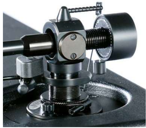
Über eine flache Rändelschraube lässt sich feinfühlig die Tonarmhöhe anpassen. Wenn's passt, die Arretierung per Inbus festziehen.

Im Innern der „control unit“ versorgt eine ebenso stabile wie präzise Elektronik den im Dreher eingesetzten Synchronmotor, der über einen kurzen Riemen eine kleine Scheibe antreibt, die den eigentlichen, aus schwarzem Acryl gefertigten sowie mit markanten Riefen versehenen Plattenteller trägt. Das Tellerlager besitzt „reinste SME-DNA“, wie McNeilis versichert, der sein Model 6 keinesfalls als gängiges „Designprodukt“ mit Schwerpunkt auf der Optik verstanden sehen will. Hier läuft eine Achse aus extrem