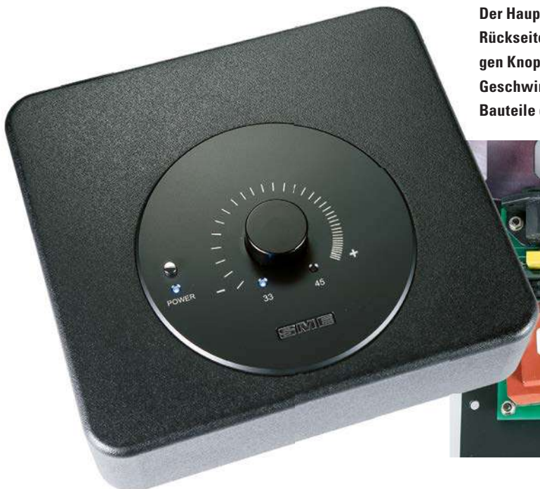
Der Hauptschalter des „Steuergeräts“ befindet sich auf dessen Rückseite. „Power“ startet den Motor, ein Druck auf den mittleren Knopf schaltet die Drehzahlen um. Per Dreh lässt sich die Geschwindigkeit extrem feinstufig regeln. Im Innern sitzen die Bauteile der so potenten wie präzisen Versorgung (u.).

Der Clou des Model 6 sind jedoch die Gehäuse für Laufwerk und Steuerteil. Diese bestehen aus einem von SME aus der Flugzeug- und Weltraumtechnikbranche bezogenen hochdichten Kunstharz, das die Engländer wie Metall auf ihren CNC-Maschinen bearbeiten können. Dieses „Resin“ ist akustisch weitgehend „tot“. Klopf man mit dem Finger gegen die Vorderseite des Drehers,